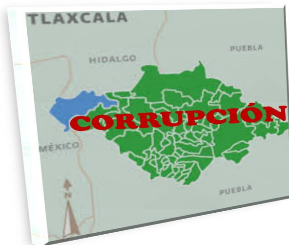
TLAXCALA, CORRUPCIÓN EN SU EXTENCIÓN

La gran solución es saber actuar frente algún acto corrupto y mantener fijos nuestros valores para así aportar nuestro granito de arena a la lucha contra este mal social llamado CORRUPCIÓN.