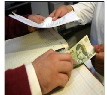
FAVORECER INTERESES PERSONALES

La corrupción es un mal social que no se limita al ámbito de gobierno solamente, ya que ésta contamina todas las esferas de la vida: la escolar, empresarial, laboral y comercial, asimismo, es un problema que afecta gravemente a las instituciones, la legitimidad de la democracia, la ética y la justicia, que distorsiona el sistema económico y constituye un